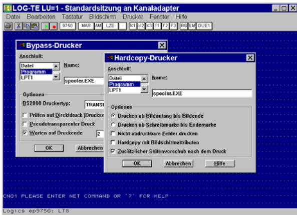
LOG-TE9750 unterstützt Hardcopy-, Bypass und Stationsdruck

LOG-TE unterstützt Hardcopy-, Bypass- und Stationsdruck. Beim Hardcopy wird der aktuelle Bildschirminhalt als Druckjob ausgegeben. Beim Bypass- und Stationsdruck steuern